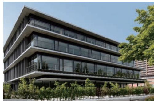
JAバンク滋賀 事務センタービル