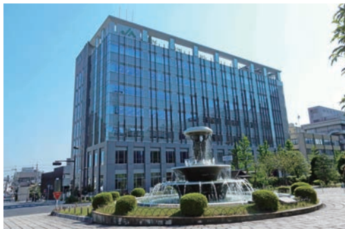
JAバンク滋賀信連 本所